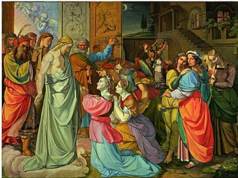
Peter von Cornelius (1784-1867), La parabole des Vierges sages et des Vierges folles, 1813-15, huile sur toile, 114x153 cm, Kunstmuseum, Düsseldorf