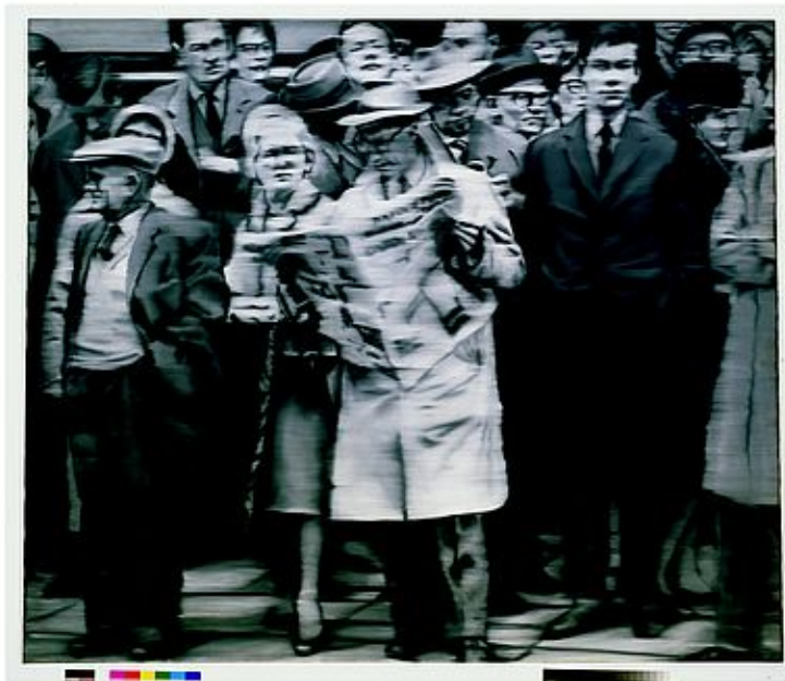
Gerhard Richter (1932-), Personengruppe, 1965, huile sur toile, 170x200 cm, collection privée