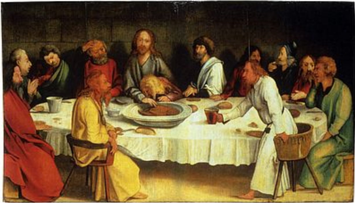
Mathias Grünewald (vers 1475-1528), La Cène, vers 1500, tempera sur bois, 48x85 cm, Kunstmuseum, Bâle